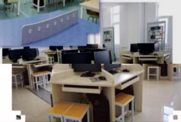
一体化课程教学设计综合实训室