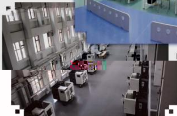
DMG 数控技术训练场所