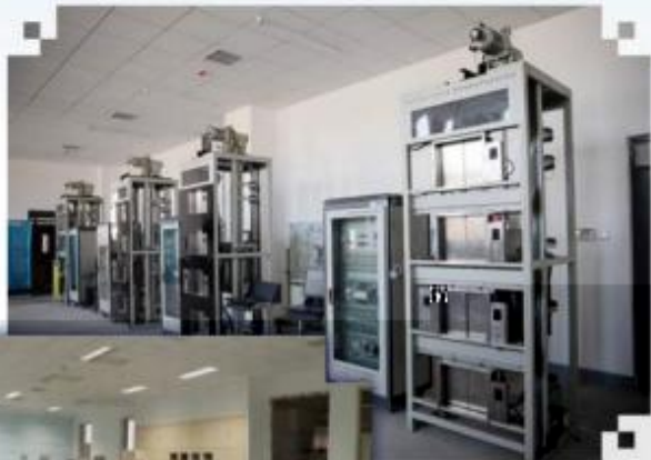
智能电梯安装调试维护训练场所